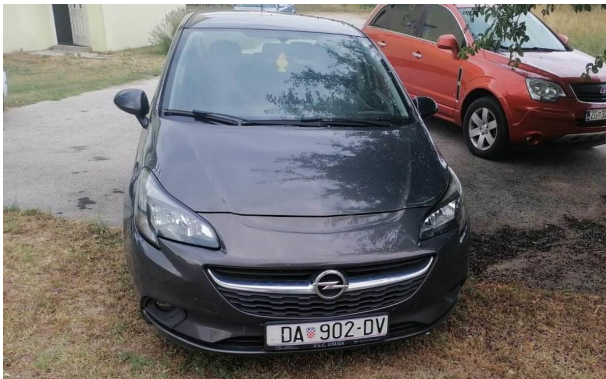
Slike 1. do 7.: Prikaz općeg stanja automobila